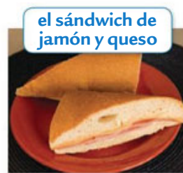
el sándwich de jamón y queso