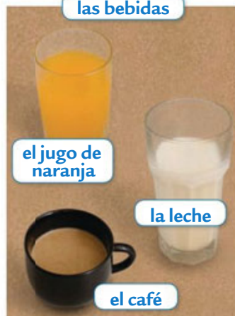
el jugo de naranja